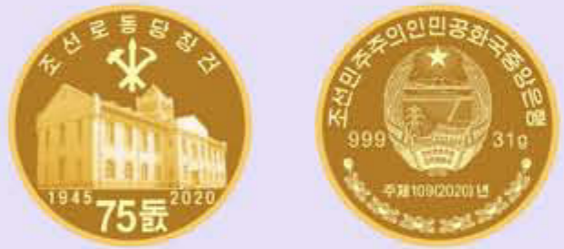
Pièce de monnaie commémorative en or « 75 e anniversaire de la fondation du Parti du travail de Corée »