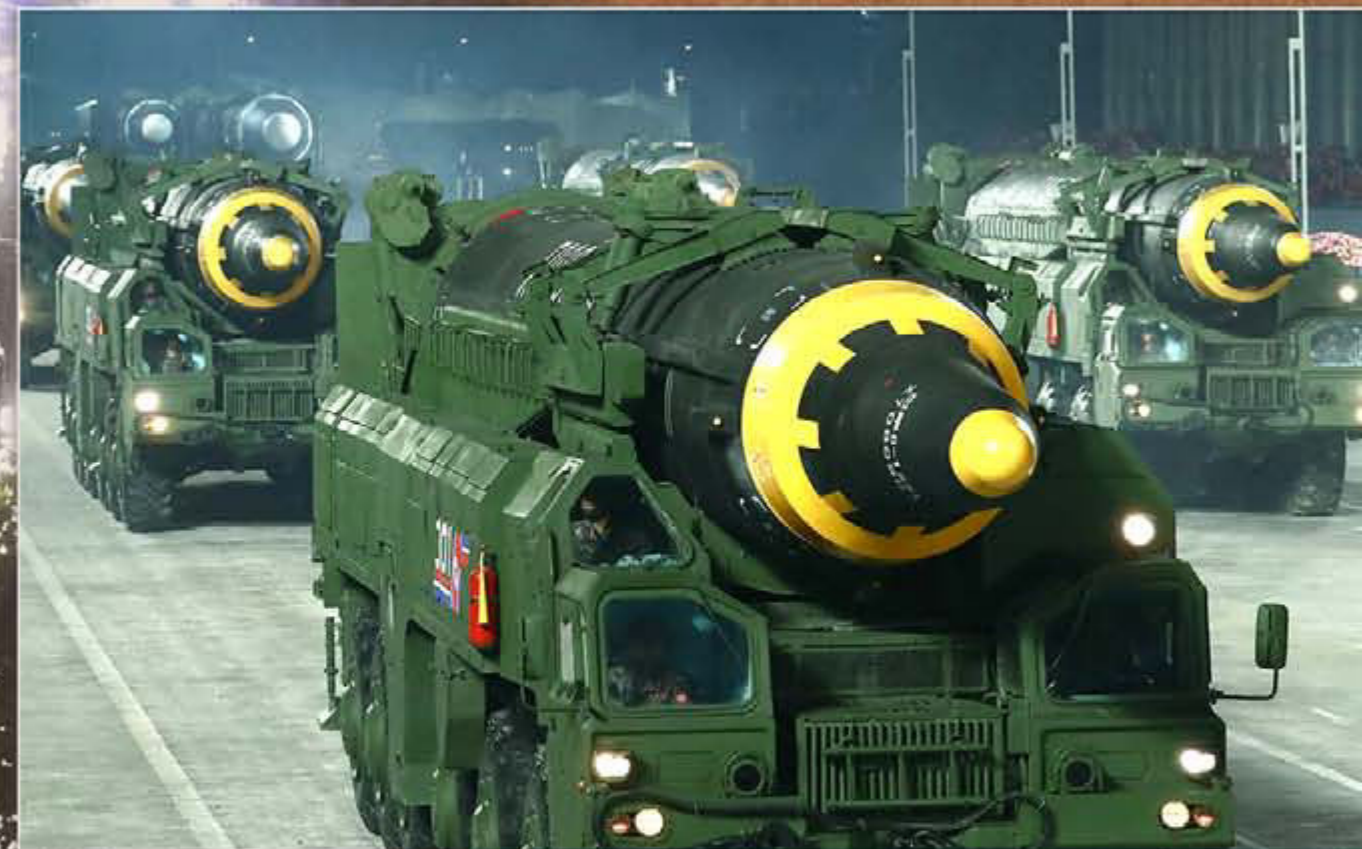
Les colonnes de fusées balistiques intercontinentales.