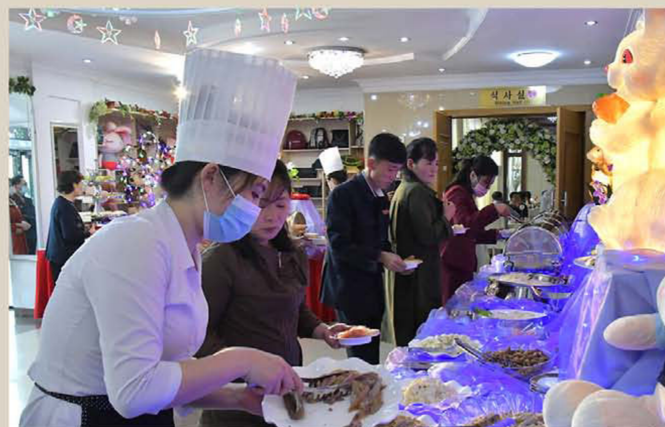
Service spécial dans les restaurants à Pyongyang et en province.