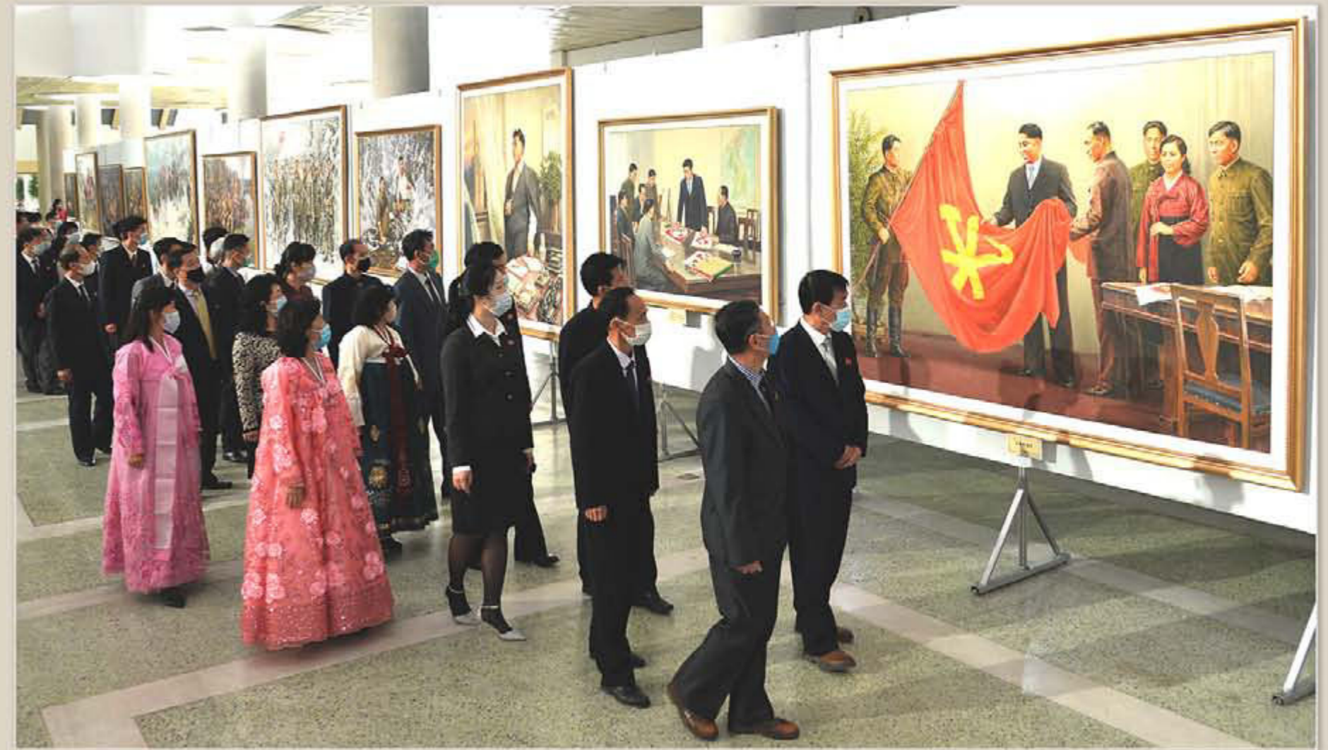
Exposition nationale de beaux-arts.

Le peuple coréen a célébré tout particulièrement le 75 e anniversaire de la fondation du PTC.