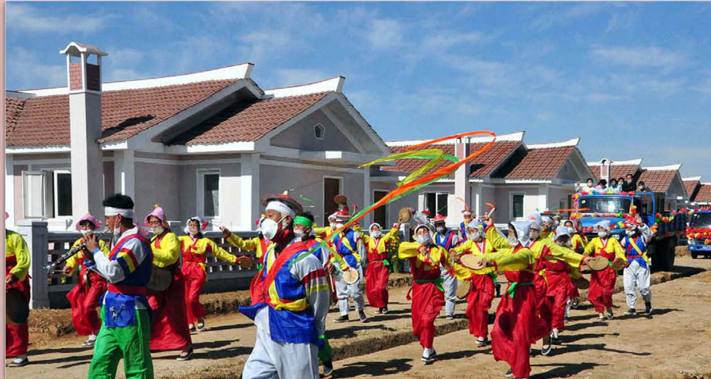
Les habitants qui ont subi des dommages de l'inondation et du typhon fêtent leur installation dans de nouveaux logements.