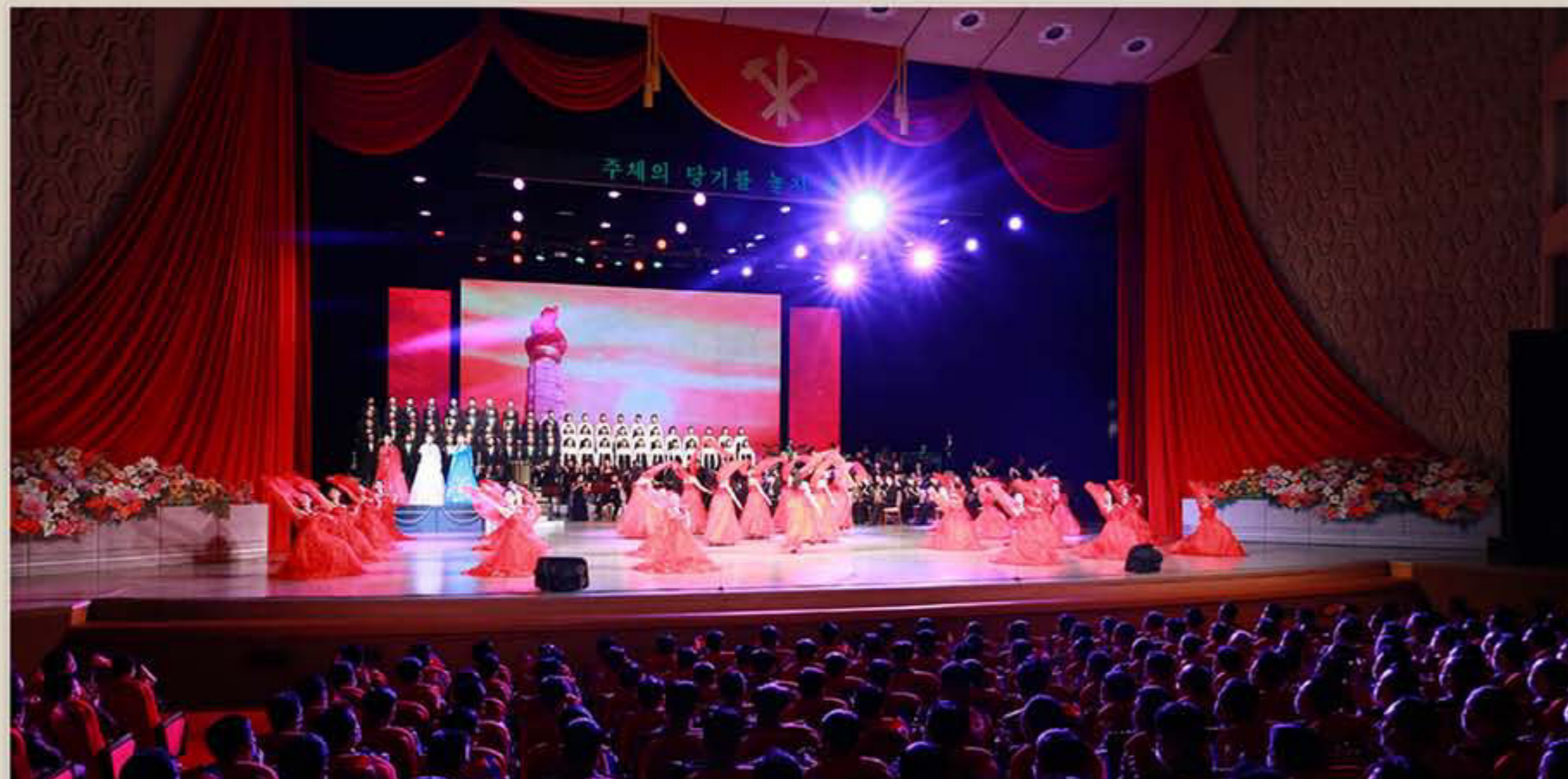
Spectacle commun de la Troupe artistique Mansudae et de la Troupe artistique Wangjaesan et concert de l'Orchestre symphonique national.