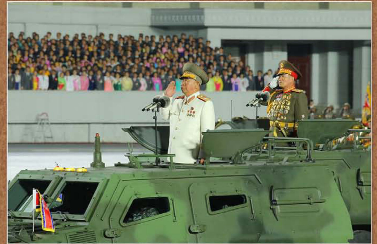
Ri Pyong Chol rapporte au Dirigeant suprême Kim Jong Un que la parade militaire est prête.

Alors qu'au son de la musique de bienvenue, il a fait son apparition à la tribune de la place, les participants l'ont ovationné chaleureusement en criant « Kim Jong Un », « Défense inconditionnelle » et d'éblouissants feux d'artifice ont été tirés dans le ciel d'octobre. Il a répondu en agitant la main à leurs acclamations enthousiastes. Au son de la musique Notre glorieuse patrie , ont été tirés 21 coups de salve. Le Dirigeant suprême Kim Jong Un a prononcé un discours passionné. Son discours plein d'amour ardent et de confiance sans