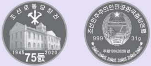
Pièce de monnaie commémorative en argent « 75 e anniversaire de la fondation du Parti du travail de Corée »