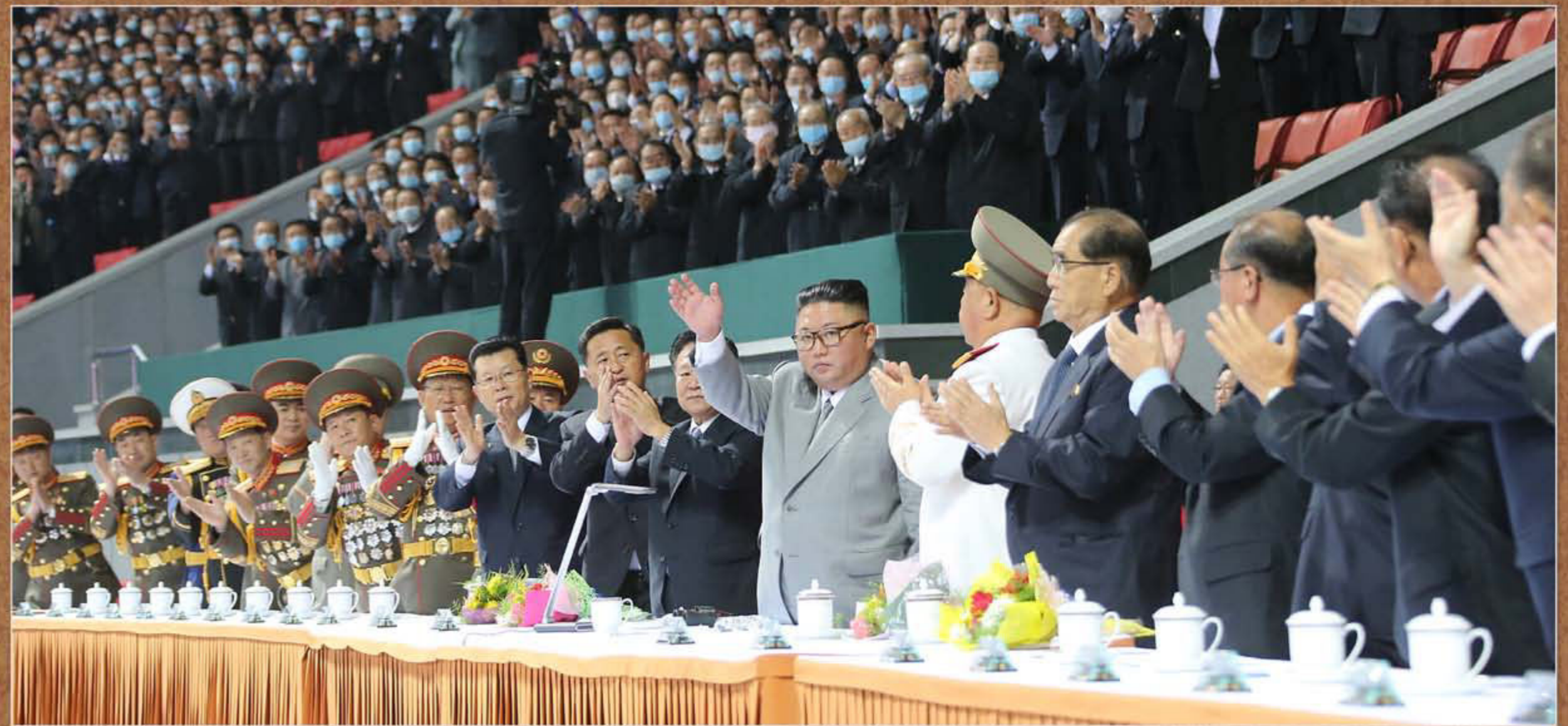
Le Dirigeant suprême Kim Jong Un adresse ses salutations cordiales aux exécutants du grand spectacle gymnastique et artistique et aux spectateurs.