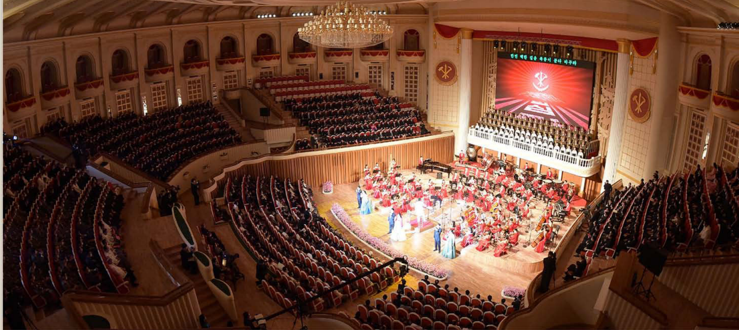
Spectacle de l'Orchestre Samjiyon.