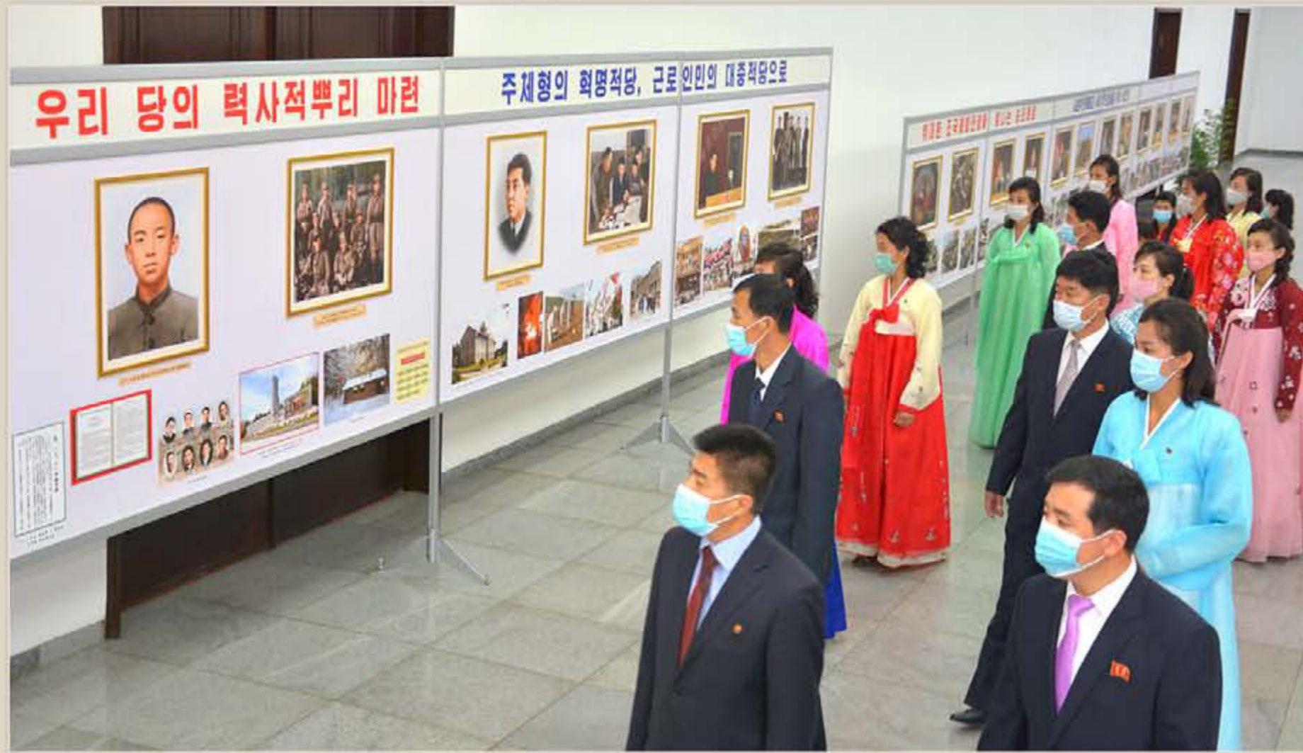
Exposition centrale de photos.