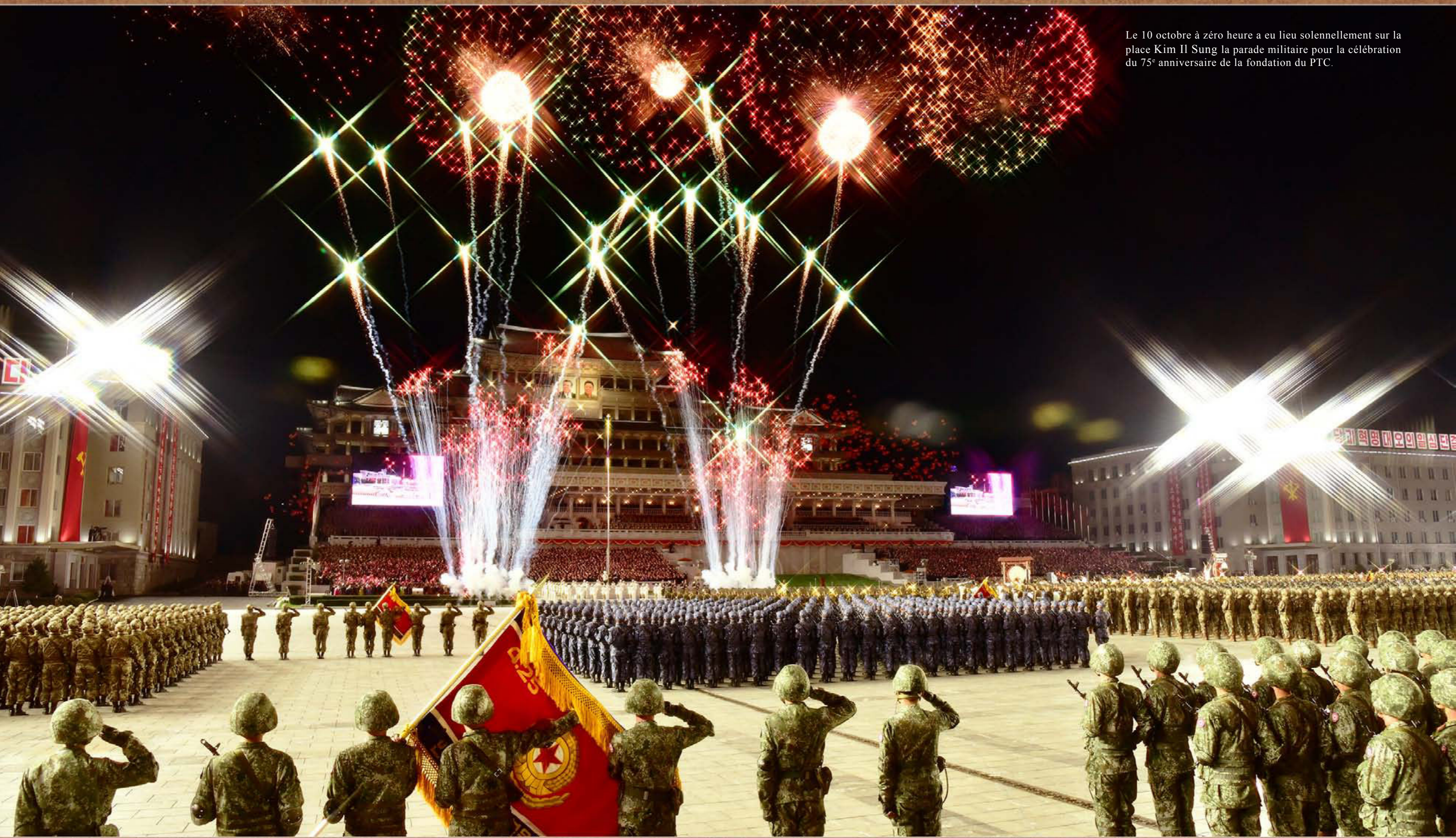
Le 10 octobre à zéro heure a eu lieu solennellement sur la place Kim Il Sung la parade militaire pour la célébration du 75 e anniversaire de la fondation du PTC.